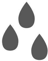
Nebugen o Nebugen Citrus

Nettifog basa su fuerza en la utilización de un poderoso cañon de niebla que en pocos instantes transforma un liquido especial en una niebla que, al mezclarse uniformemente con el aire, permite una desinfección extremadamente rápida, total y absoluta.