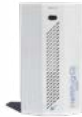
Cañon de niebla Nettifog